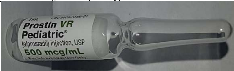
Image de l'ampoule approuvée aux États-Unis