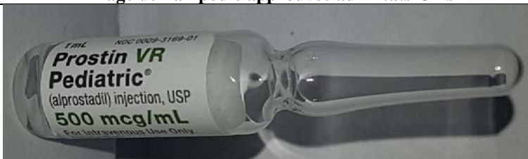
Image de l'ampoule approuvée aux États-Unis