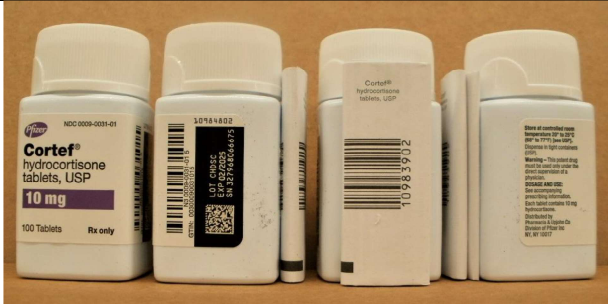
Image du produit CORTEF destiné au marché américain